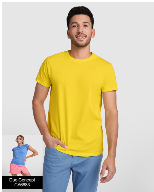
Duo Concept CA6683