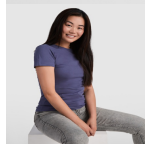
Duo Concept CA6627