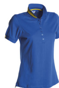
BLU ROYAL/GIALLO-BLU NAVY